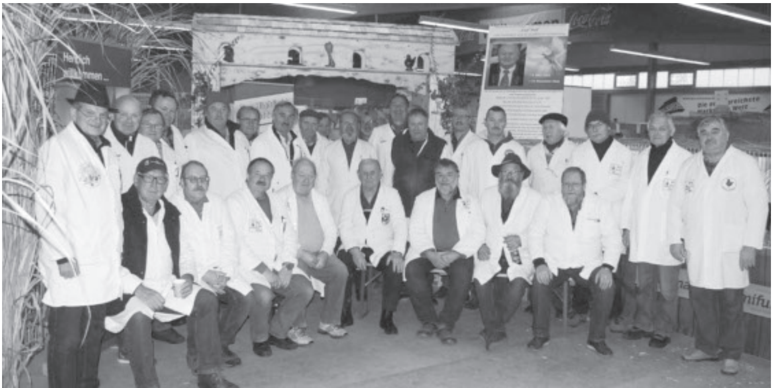
Die amtierenden Preisrichter