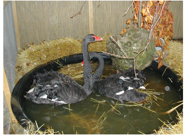
Straßkirchener Hingucker: Links Preise der HSS der Dt.Modeneser 2003 auf einem Kleebock und oben Trauerschwäne von Richard Schreiner bei der BSS der King mit Lokalschau.