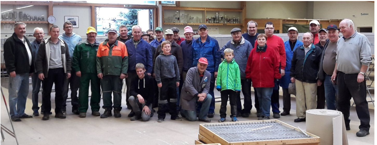
Unsere Aufbautruppe bei der Bezirksschau 2016 im Alter von 7 bis 87 Jahren.