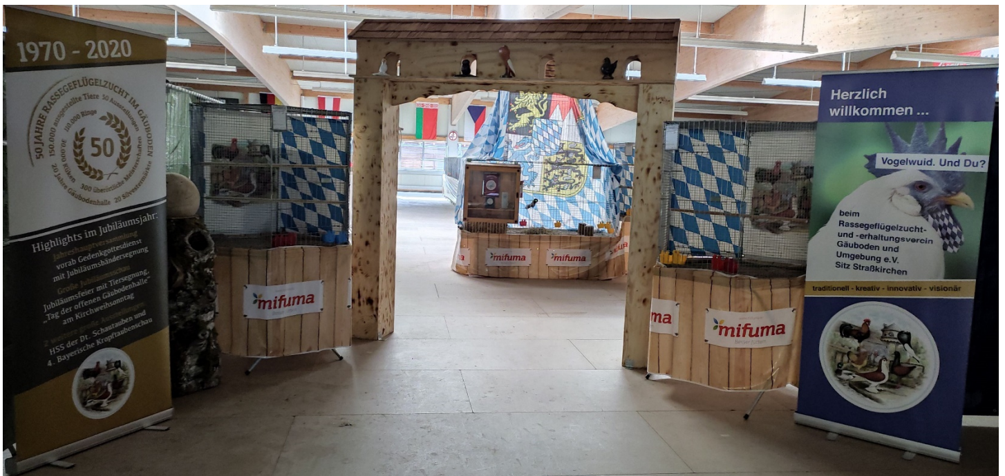
Der Eingang zu den HSS'n der Dt. Modeneser und der Mährischen Strasser & Prachener Kanik 2021.