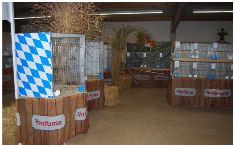
Voliere Bay.Kröpfer auf der 3.Bay.Kropftaubenschau 2015 mit 2001 Kröpfern, die HSS der Strasser mit Lokalschau hatte 2380 Nrn.