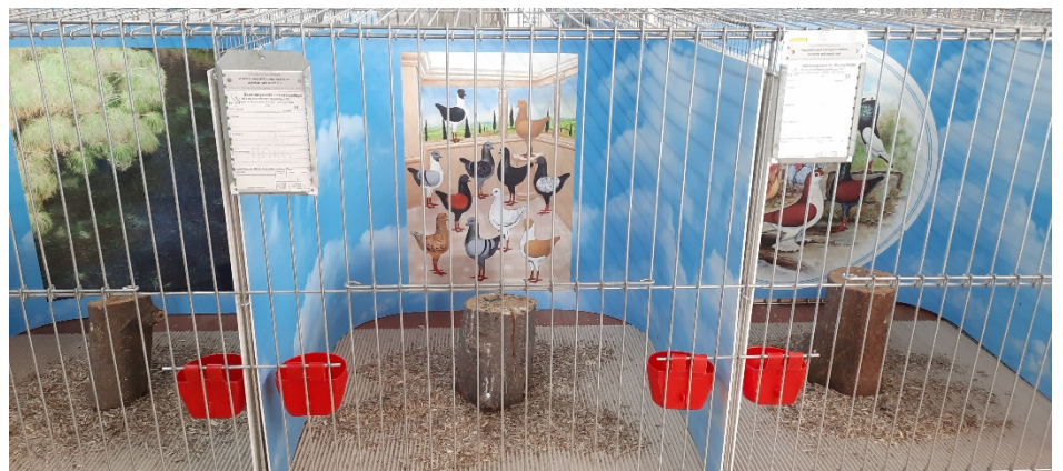
Natürlich wieder international, die Stammkäfige herrlich dekoriert mit den von Richard Weiss gefertigten Rückwänden mit unterschiedlichen Motiven und Logos unseres Vereins – so präsentiert man schöne Tiere in schöner Umgebung – es waren 1675 Nrn., davon 53 Voliere/Stämme ausgestellt.