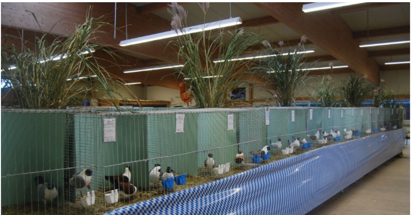
Das Motto der 50.HSS der Dt.Modeneser 2014: 50 Stämme in 50 verschiedenen Farben.